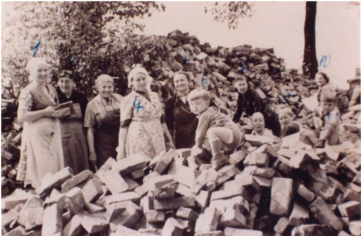
Warther Frauen beim Steine säubern, oder auch „Steen klopp“ genannt.