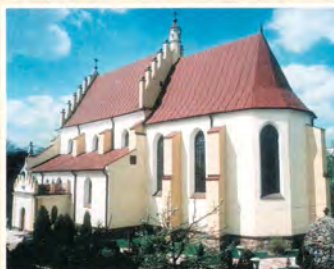
Mościska, 8 października 2003 r

вул. І. Франка, 81300 Мостиська, Україна