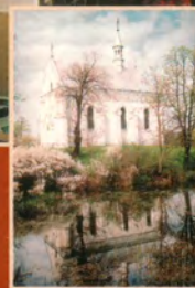
Kościół św. Michała Archanioła na Zakościelu