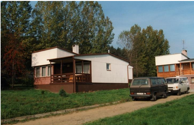
Campinghäuser in Nysa

Vom 14 bis zum 22 Oktober sind alle Mitglieder des Aktionskreises, einschließlich Familie und Kinder nach Nysa (Neiße) gefahren. Wir haben dort 2 wunderschöne Wochen gemeinsam verbracht, dieses Mal ohne Arbeit und ohne Verteilung der Sachen.