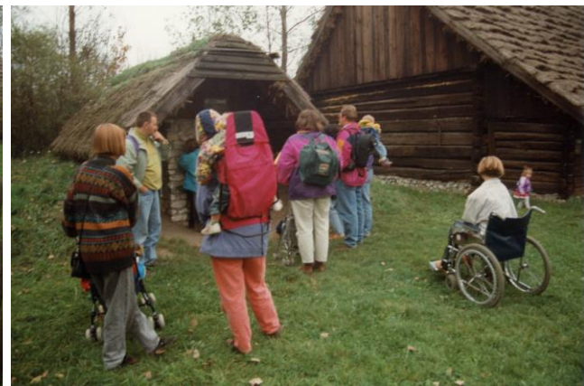
Freilichtmuseum bei Oppeln