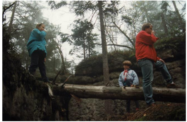
Ausflug ins Riesengebirge