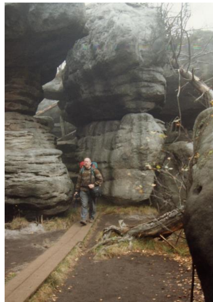
Labyrinth „Błędne Skalki“